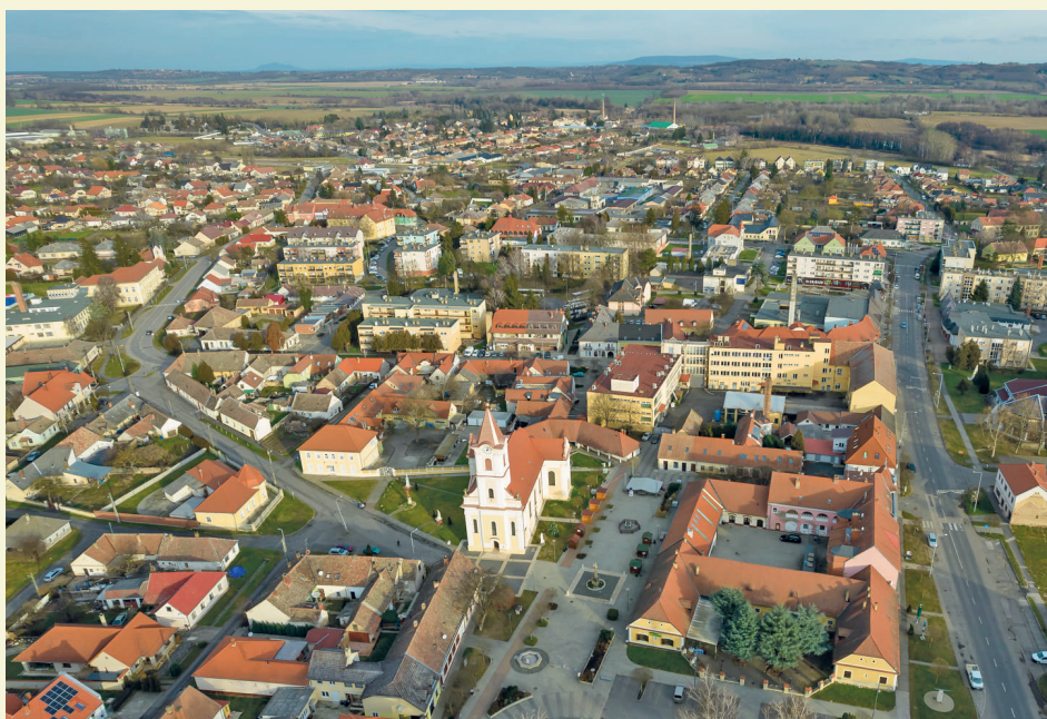
Több városba látogató szerint Szentgrótnak van egy különleges atmoszférája, valamint tisztaság és rend