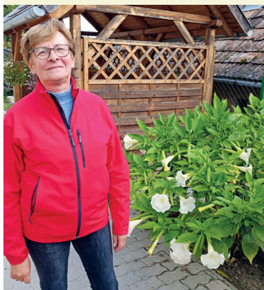
Őné: sokan kiskorú gyermekekkel érkeztek

– Örömteli, hogy városunkba jöttek, minden bizonnyal tetszik nekik Zalaszentgrót, és valószínűleg az infrastrukturális ellátottsággal is elégedettek. Persze még számtalan oka lehet annak, amiért itt telepedtek le. A társadalom különböző rétegeihez tartoznak, különböző foglalkozásúak, még válogatott futballista is akad közöttük, velem is beszéltem már. A beszélgetések során kiderült egyébként, hogy részt akarnak venni, szerepet akarnak vállalni a közösség életében. Páran közülük még tovább generálják a városba költözők létszámát, például a Zalaudvarnokra költözött, ott zenei stúdiót létrehozó lakó baráti köréből többen szintén itt találtak maguknak új otthonot. Mindez előnyös Szentgrótnak, az új lakók új szintet hoznak a városba, és ettől egy kicsit mi is mások leszünk. Az is örömteli, hogy a városból korábban elköltözöttek közül szép számmal települnek haza, visszahozza őket a városunkra jellemző összetartó erő. Az ország más részein élő ismerőseim mondják szentgróti látogatásukkor, hogy különleges atmoszférája van a városnak. Jó ezt hallani, de én még ennél is fontosabbnak tartom, hogy az itt élők boldogulni tudjanak, jól érezzék magukat, boldogok legyenek, és tisztaság, biztonság, rend legyen Zalaszentgróton. Ez ad egy hamisítatlan, magával ragadó szentgróti hangulatot. Az itt letelepülteket pedig arra kérem, amennyiben információra, segítségre van szükségük, nyugodtan forduljanak hozzám a város online platformjain, vagy személyesen – mondta Baracska József.