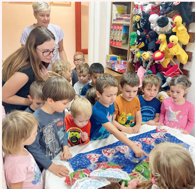
A csoportok izgatottan járták végig a hagyományörző vásár standjait

A vásárt a kisbíró hangos invitálása nyitotta meg. A csoportok izgatottan járták végig a vásári standokat, megkezdődött a vásárlás, alkudozás, válogatás.